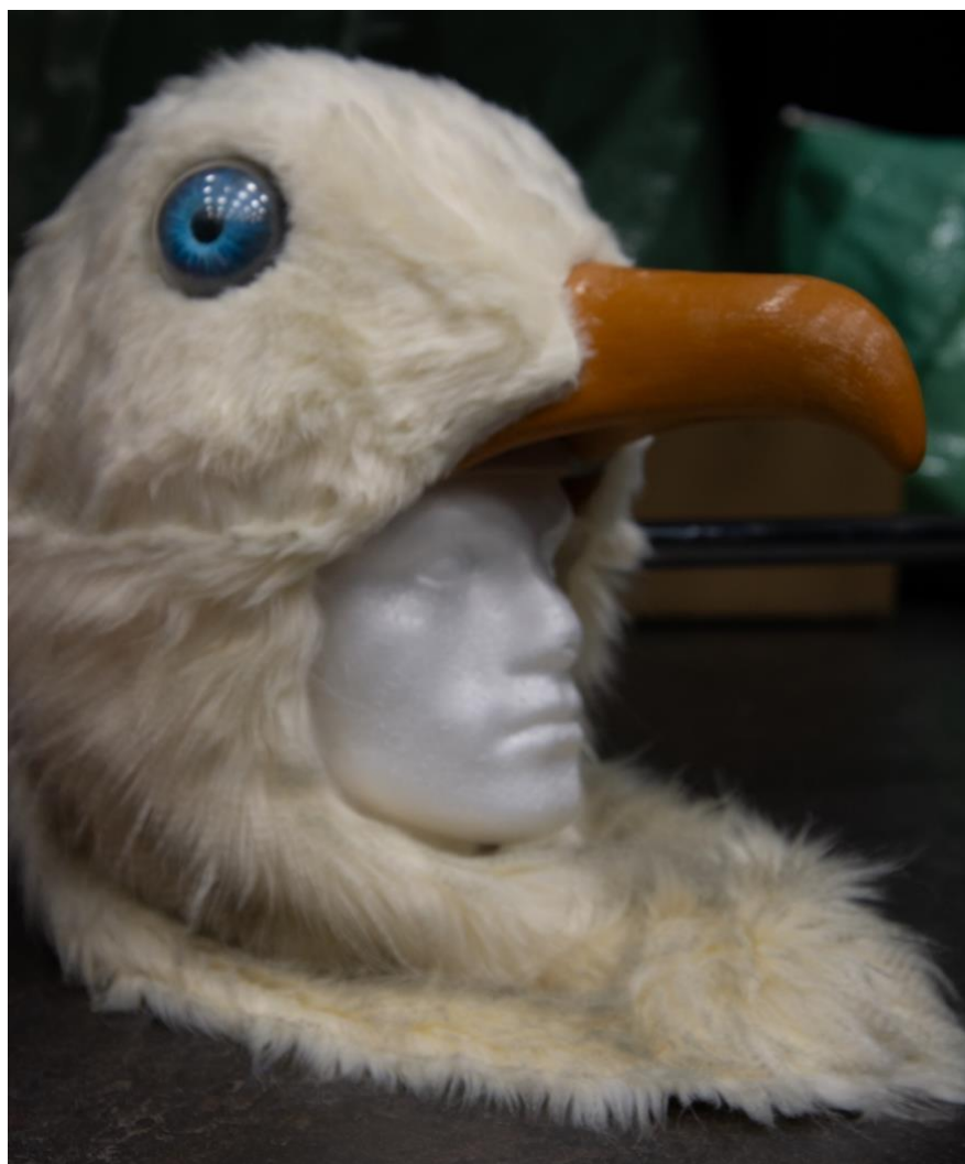
Kostymen i föreställningen har designats av Märta Lööv. Här ser vi Måsens ansikte.

Estrad Norr har skapat en film som på ett lekfullt sätt skildrar processen med att skapa en opera-/musikteaterföreställning. Se gärna filmen tillsammans med dina elever som en del av förberedelsen. Filmen skickas till dig av producent Monica Bergander, kontakta oss om det skulle uppstå några problem. Nedan följer en ordlista som beskriver olika delar av arbetet med en operaföreställning. Ordlistan finns med för att underlätta förberedelsearbetet.