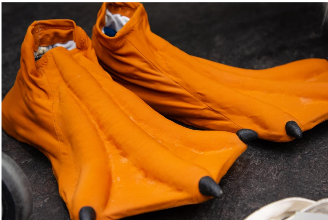
Måsens fötter.

Utöver de roller som beskrivits ovan finns många andra personer med i arbetet med att skapa en operaföreställning. Mer information om medverkande i produktionen Önskningarnas ö hittar du i slutet av lärarhandledningen.